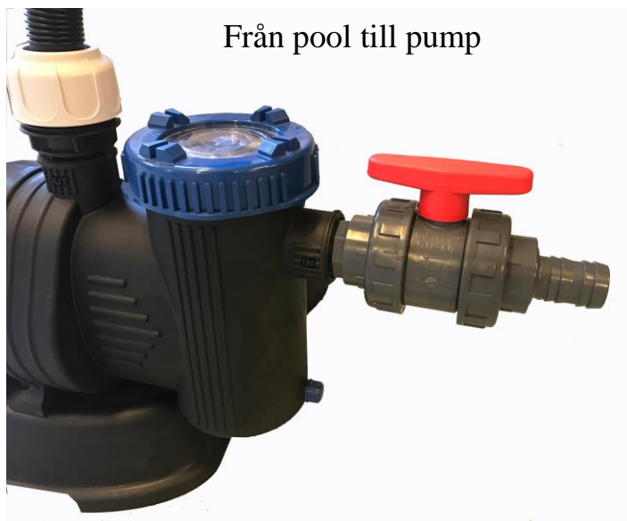
Från pool till pump