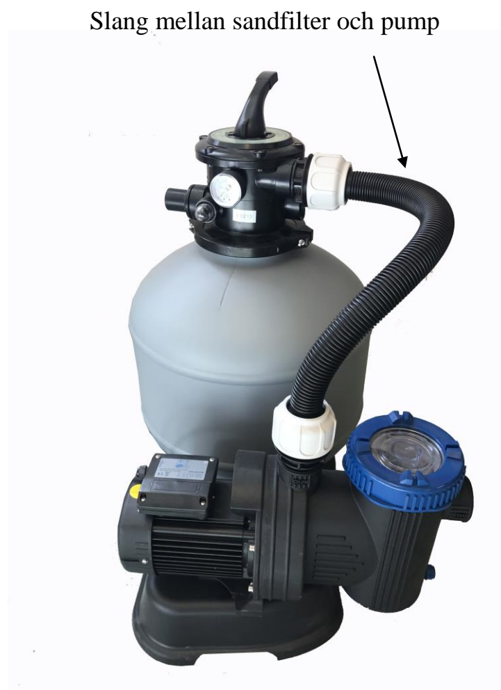
Slang mellan sandfilter och pump